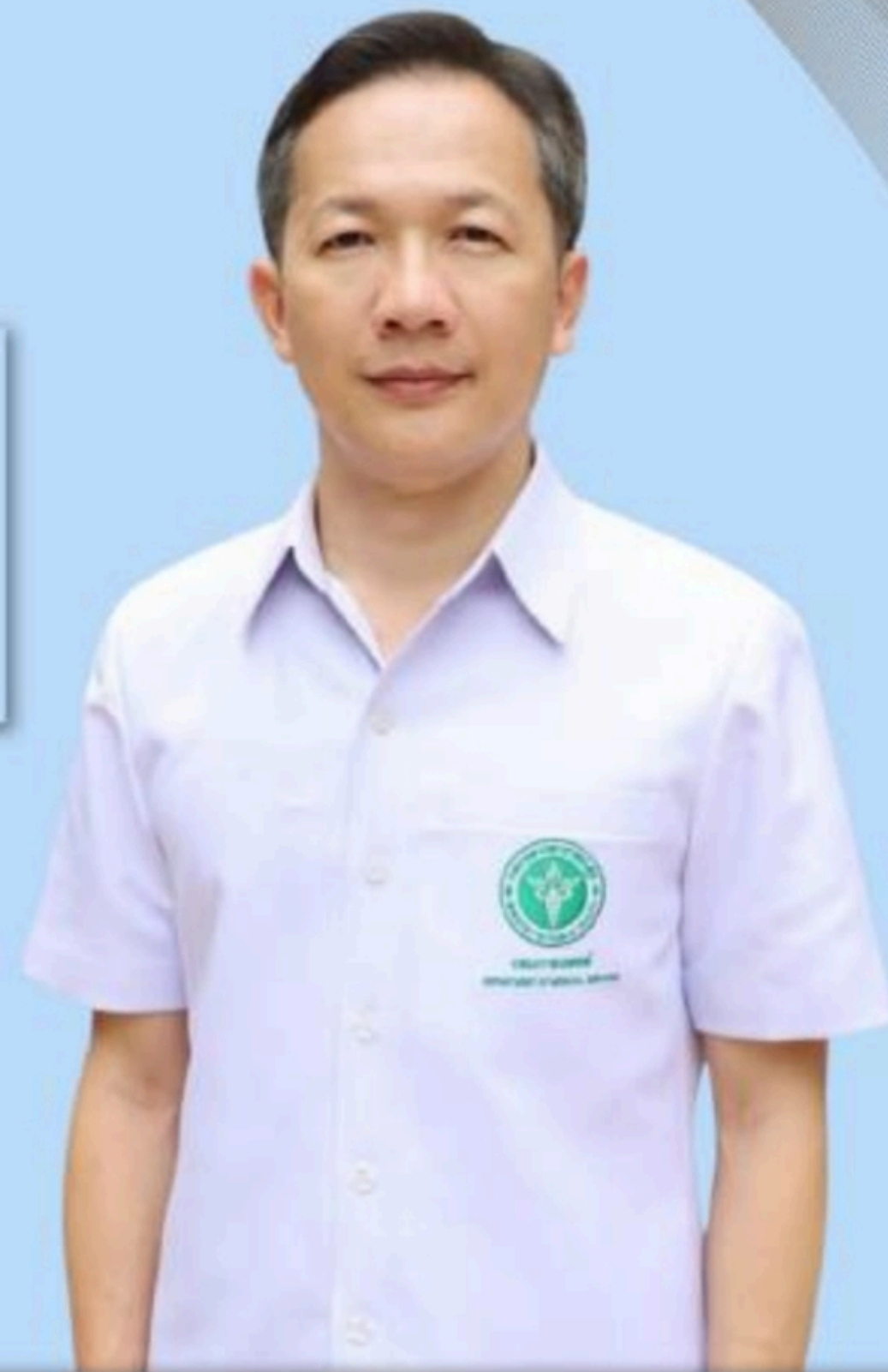
นายแพทย์ณัฐพงศ์ วงศ์วิวัฒน์

รักษาการในตำแหน่งผู้ตรวจราชการกระทรวงสาธารณสุข เขตสุขภาพที่ 8