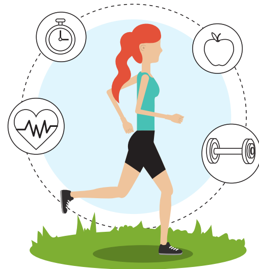
การออกกำลังกาย และยืดเหยียด