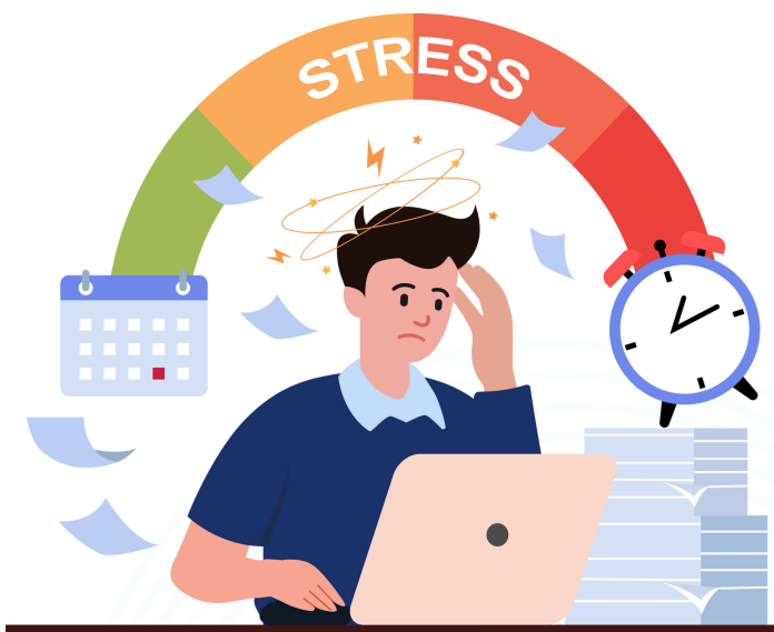
การทำจัดการความเครียด