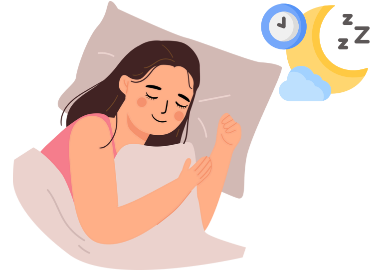
การนอนหลับ อย่างมีคุณภาพ