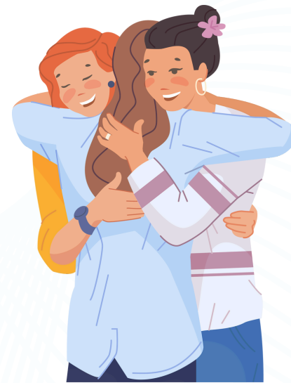
มีความสัมพันธ์ที่ดี กับคนรอบข้าง