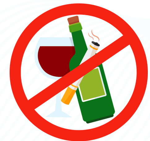
หลีกเลี่ยง ยาเสพติด บุหรี่ แอลกอฮอล์