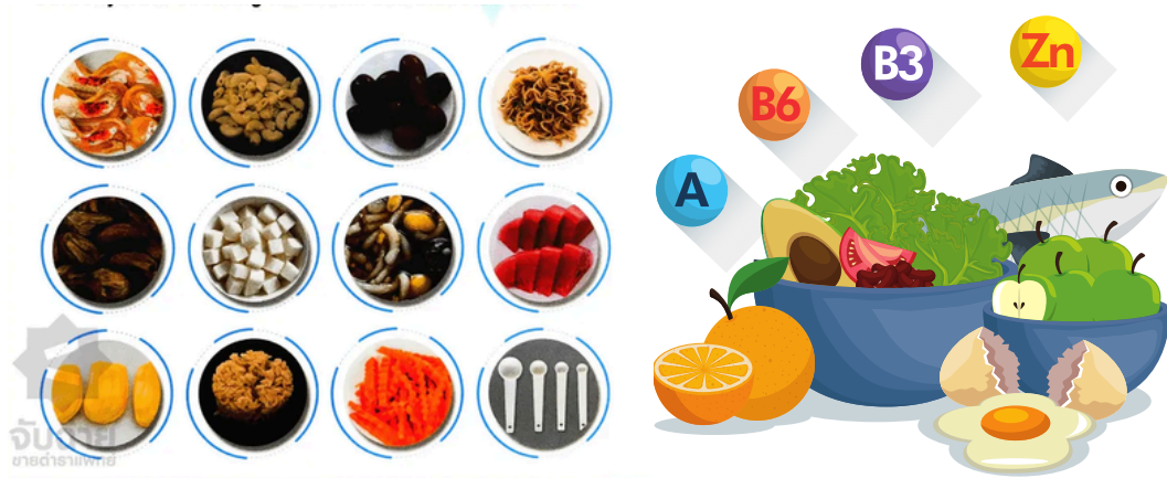
การนับคาร์บกิน อาหารเป็นยา