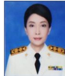
หัวหน้ากลุ่มงานบริหาร กรรมการ